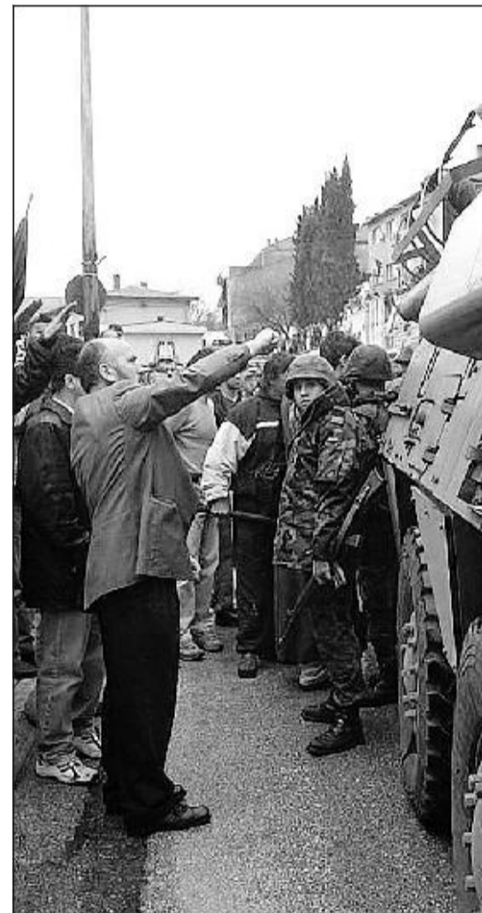
Nazionalisti croati in Bosnia

fianco sempre più numerose dell'Europa unita. Dal convegno di Trento è arrivato un monito forte: spazzato via il Verbo comunista, manca una sinergia tra gli individui. A costruire un progetto comune non può servire un individualismo sfrenato e nemmeno un integralismo collettivo di tipo religioso. Sarebbe necessario rispolverare una delle utopie più forti che ha attraversato la storia dell'umanità: quella che parlava di salvare il mondo, di cercare un'uguaglianza che riguardi tutti. Che non sia pa-