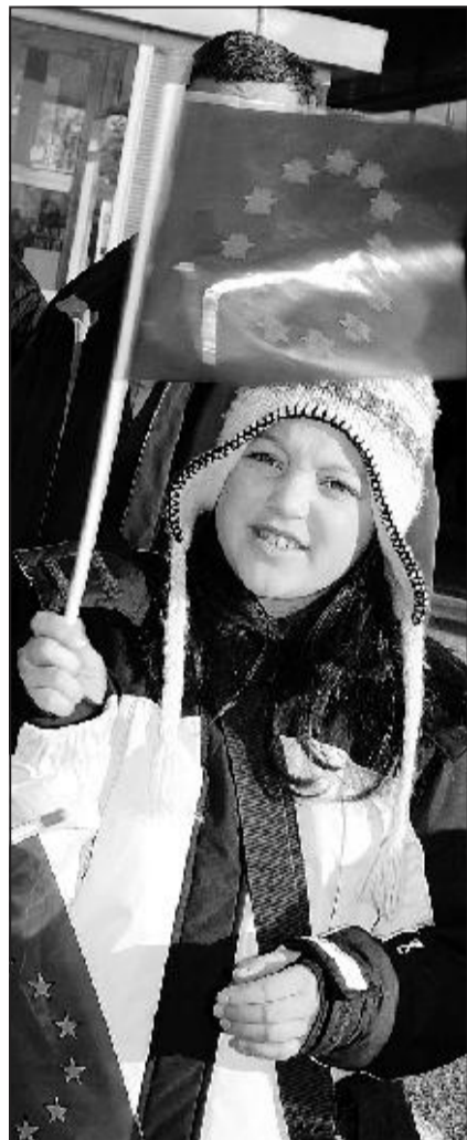
È il 2007: cade il confine Italia-Slovenia

e la corruzione riescono a manovrare perfino i movimenti nazionalisti - ha spiegato Lubonja -. Il loro gattopardismo è esemplare. Se ne fregano della Patria, di tutte queste belle bandiere che vanno sventolando. Dietro la retorica ci sono interessi fortissimi. Che privilegiano soltanto un'élite e creano situazioni sempre più evidenti di disuguaglianza all'interno del Paese».