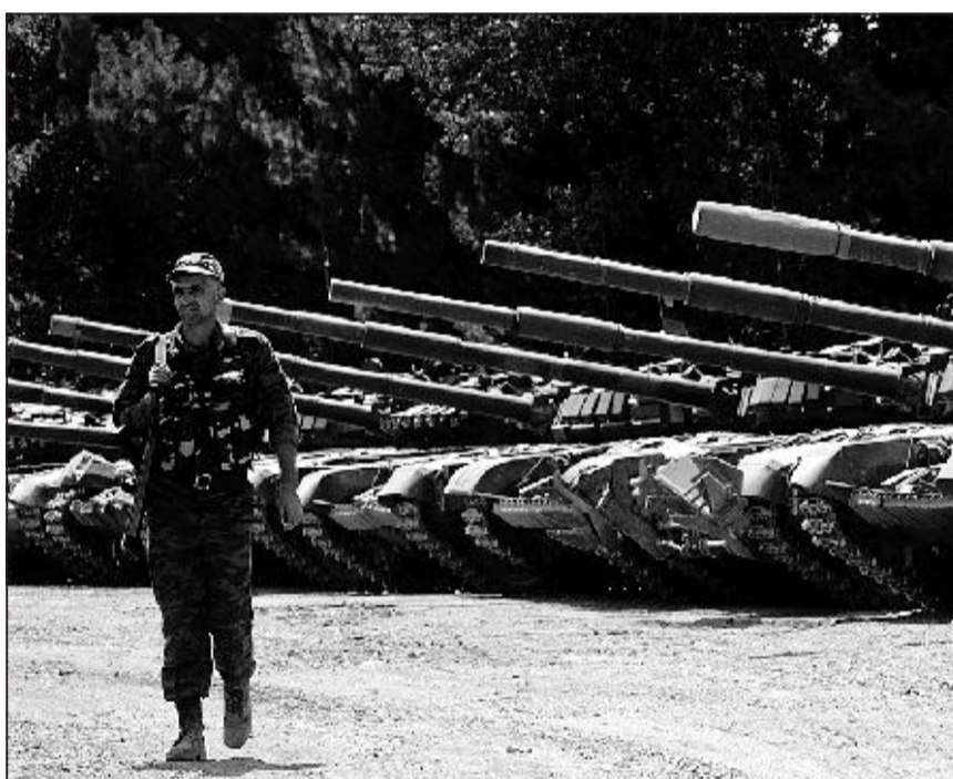
Scene di guerra tra Russia e Georgia nel 2008, l'Europa non si sbilancia