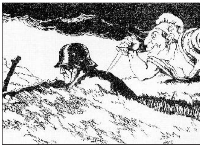
Una cartolina postale antisemita diffusa negli anni della Shoah