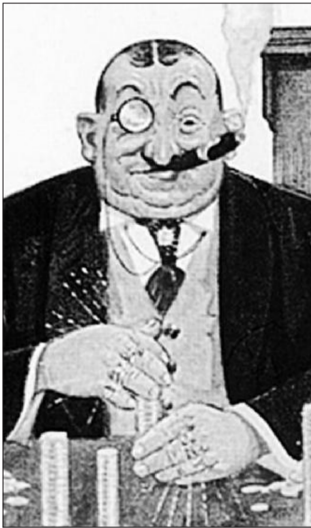
Immagine antisemita, dalla mostra allestita nel 2008 a Trieste