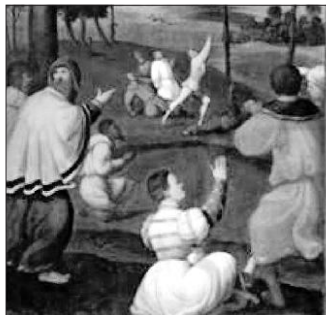
Una delle tavole del Fogolino ricostruite a Gorizia