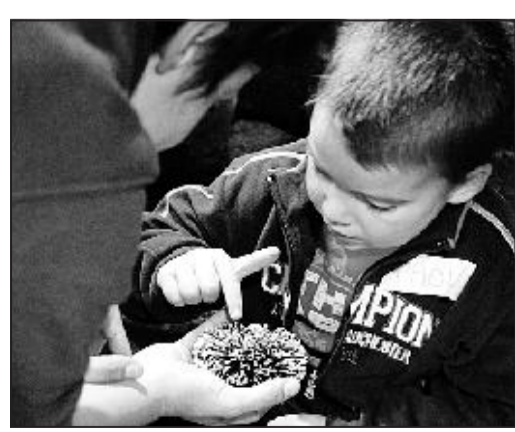
Piccoli e grandi alla scoperta della biodiversità